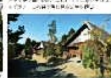
白嶽の絶景を眺める。美しい自然が広がる。絶景を眺める。美しい自然が広がる。