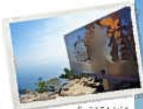
白嶽の絶景を眺める。美しい自然が広がる。絶景を眺める。美しい自然が広がる。

緑豊かな山頂に広がる白嶽は、眺望が抜群で、自然の豊かさを感じさせる素晴らしいスポットです。子どもから大人まで気軽に楽しめる、おすすめコースをご紹介します。白嶽には、自然の豊かさを感じさせる素晴らしいスポットです。子どもから大人まで気軽に楽しめる、おすすめコースをご紹介します。白嶽には、自然の豊かさを感じさせる素晴らしいスポットです。子どもから大人まで気軽に楽しめる、おすすめコースをご紹介します。