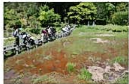
白嶽の絶景を眺める。美しい自然が広がる。絶景を眺める。美しい自然が広がる。