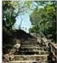
山頂には展望台があり、天草五橋と松島の島々を一望することができます。