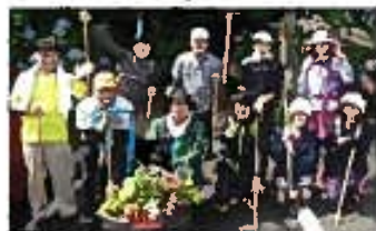
【一社】天草西原観光協会

〒862-0001 天草市西原町西原1-1-1 TEL 0964-44-1111