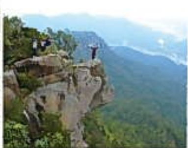
丸尾谷盆地を一望できる次郎丸嶽と太郎丸嶽の絶景。