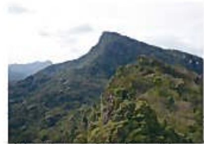
丸尾谷盆地を一望できる次郎丸嶽と太郎丸嶽の絶景。

次郎丸嶽(397m)と太郎丸嶽(281m)は兄弟峰で、同じ丸尾谷盆地にそびえ立っている。次郎丸嶽は丸尾谷盆地の東側に、太郎丸嶽は西側にそびえ立っている。丸尾谷盆地は、丸尾川が流れる谷間にあり、丸尾川は丸尾谷盆地を流れて、丸尾川河口で太平洋に注いでいる。丸尾谷盆地は、丸尾川が流れる谷間にあり、丸尾川は丸尾谷盆地を流れて、丸尾川河口で太平洋に注いでいる。丸尾谷盆地は、丸尾川が流れる谷間にあり、丸尾川は丸尾谷盆地を流れて、丸尾川河口で太平洋に注いでいる。