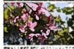
白嶽の絶景を眺める。美しい自然が広がる。絶景を眺める。美しい自然が広がる。